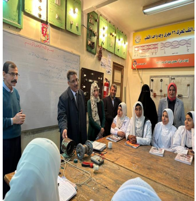
ندوة بمكتبة المدرسة لترشيد استهلاك الطاقة